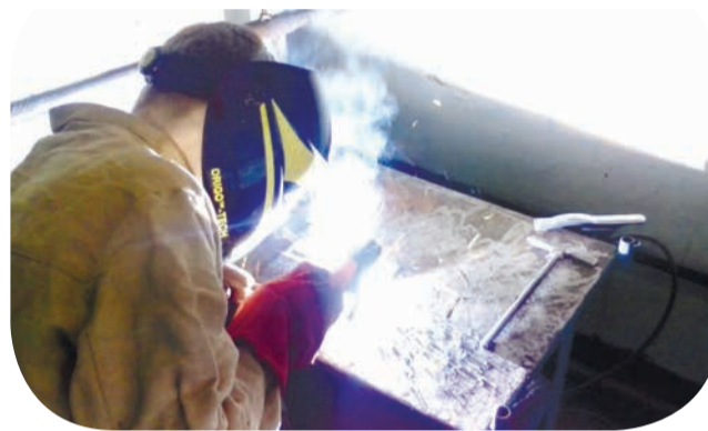
Основные задачи конкурса:

Ключевыми принципами Всероссийской олимпиады профессионального мастерства являются информационная открытость, справедливость, партнерство и инновации.