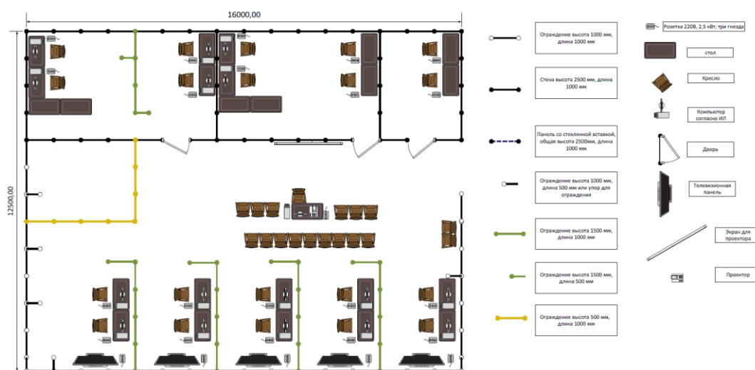
Рисунок 2. Схема конкурсной площадки

Возможная схема конкурсной площадки приведена ниже (см. Рисунок 2. Схема конкурсной площадки).