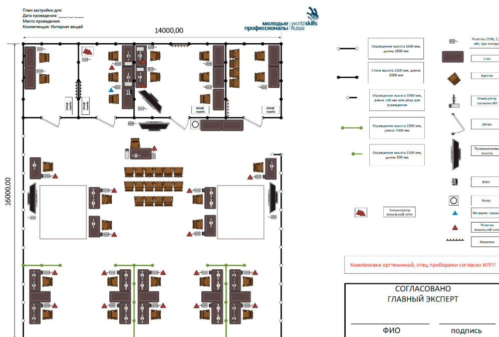
Рисунок 2. Схема конкурсной площадки

В комнатах экспертов необходимо установить запираемые шкафы для хранения ценных вещей участников и экспертов.