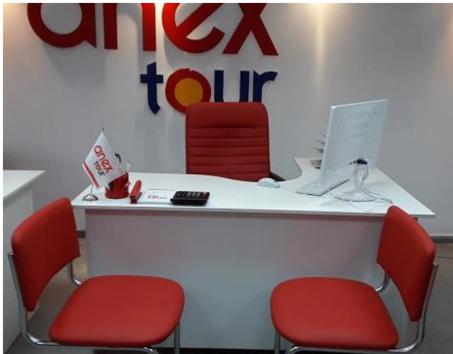
Рис. 1. Рабочее место участника (примерный вариант)

В данном разделе также приведены основные фото, эскизы необходимые для визуализации компонентов застройки конкурсной площадки.